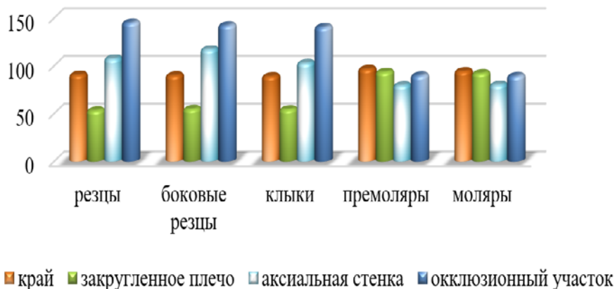
График 1. Результаты измерения краевого зазора у разных групп зубов

Сравнительный анализ между группами показал, что зазор с точки края у разных групп зубов практически не отличался. В тоже время величина зазора в финишной линии с закругленным плечом у премоляров превышала этот показатель у резцов, боковых резцов и клыков на 43,01% ( p < 0,05 ), 41,3% ( p < 0,05 ) и 41,73% ( p < 0,05 ) соответственно. Показатель краевого зазора в финишной линии с закругленным плечом у моляров был выше, чем у резцов на 42,21% ( p < 0,05 ), выше, чем у боковых резцов на 40,48% ( p < 0,05 ) и выше, чем у клыков на 40,91% ( p < 0,05 ) (график 1).