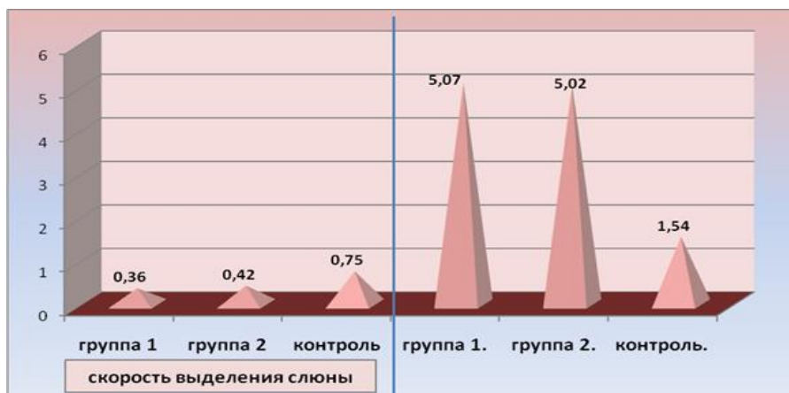
График 2. Скорость выделения слюны у больных шизофренией

Количество выделенной слюны, полученной аналогичным способом во второй группе, которую составили больные с другими психическими расстройствами, колебалось в пределах 0,42 \pm 0,029 , что было значительно выше, чем в предыдущей группе больных шизофренией. Самая благоприятная тенденция в изменении функционального состояния слюнных желез ротовой полости наблюдалась в контрольной группе, где обследовались лица, не подверженные какой-либо общесоматической патологии, то есть это были практически здоровые лица. Скорость слюноотделения у этой группы обследуемых достигла максимальных значений и фиксировалась в цифровых значениях, составивших в среднем 0,75 \pm 0,018 , что почти в два раза выше, чем в первой группе и в 1,5 раза больше данных, зарегистрированных во второй группе больных (граф.2).